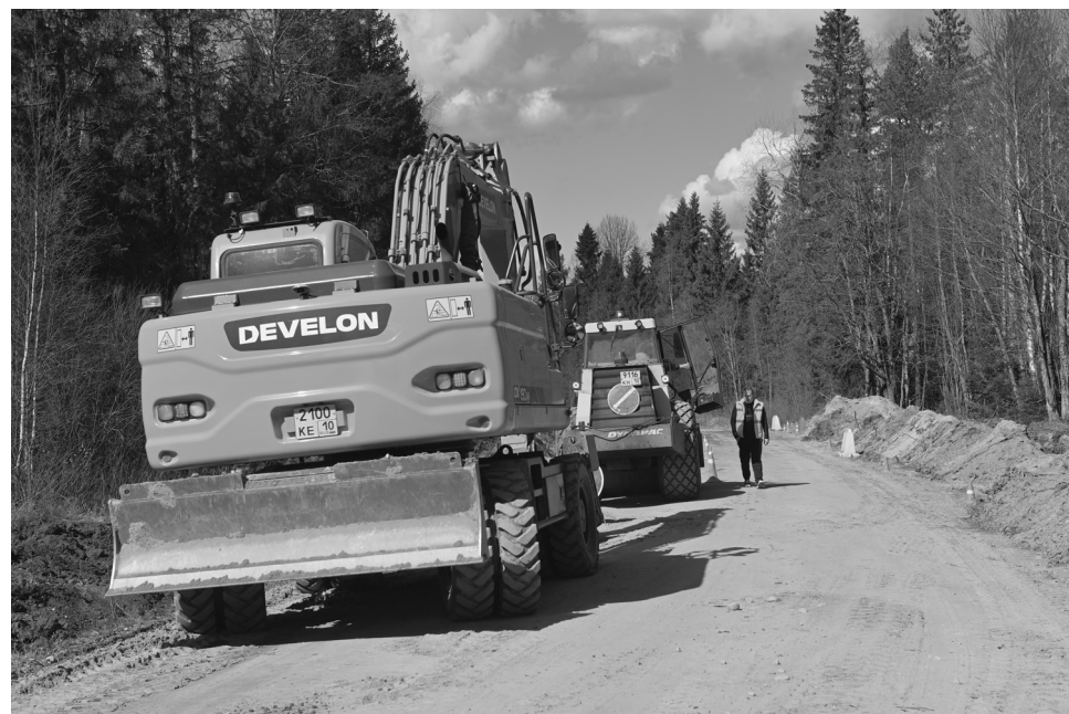
Маршрут в Утозеро