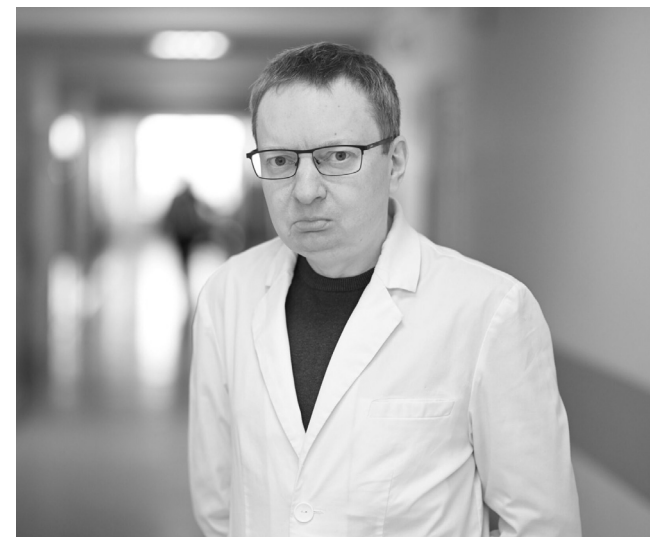
Андрей Малафеев, главный внештатный кардиолог Минздрава Карелии