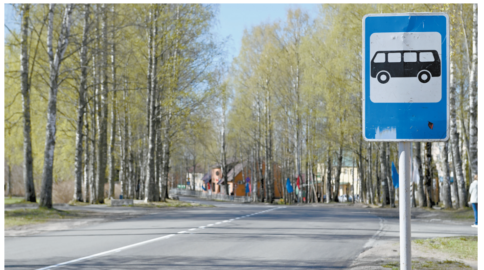
Дороги в Пряже

Подрядчик пообещал, что ширину лежащих полицейских приведут в нормативное 11–17 мая. После этого искусственные неровности выделит разметкой и дорожными знаками. (Окончание на 8-й стр.)