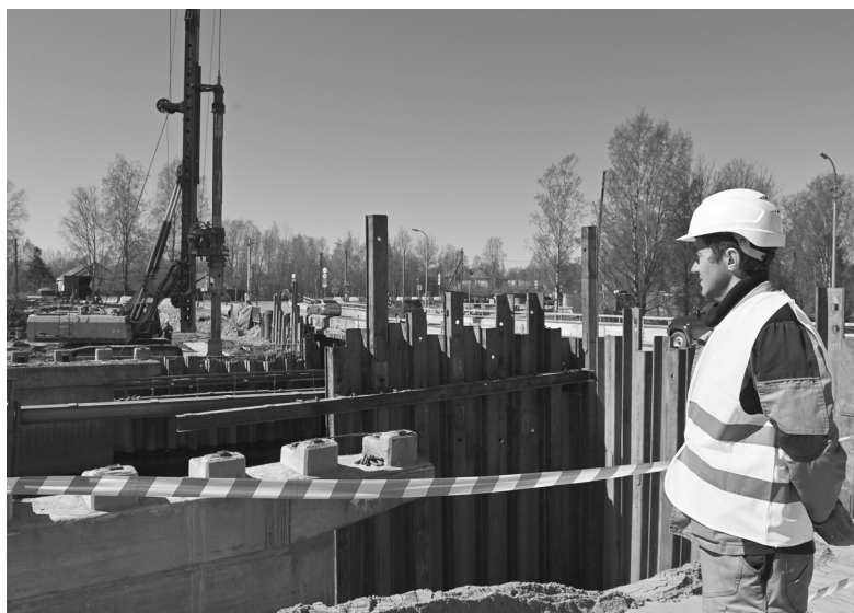
Строительство моста в Олонце

В деревне Утозеро расположены 47 домовладений, где на постоянной основе живут 15 семей. Весной и летом в насе-