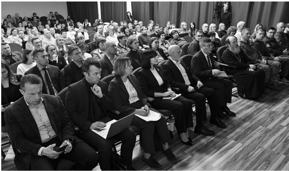
Встреча с населением