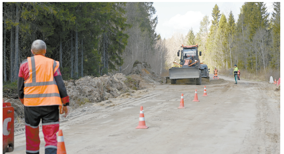
Маршрут в Утозеро

ХОЧЕШЬ УЗНАВАТЬ НОВОСТИ ПЕРВЫМ? ПОДПИСЫВАЙСЯ НА САМПО ТВ 360°!