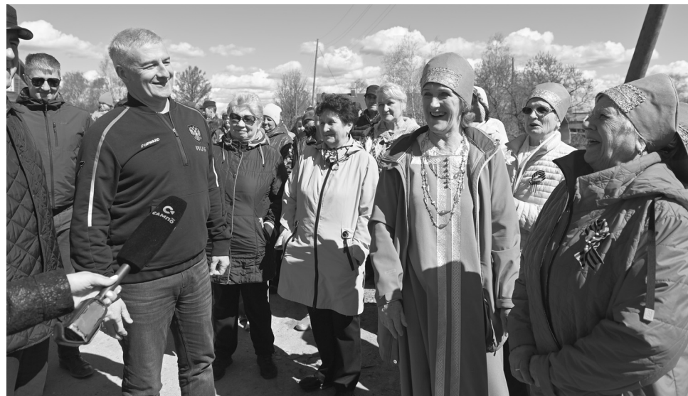
Открытие моста в Туксе