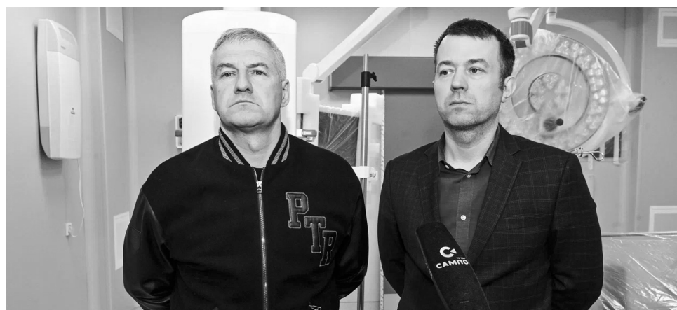
Артур Парфенчиков и вице-премьер правительства Карелии по развитию инфраструктуры Виктор Россыпнов

В Республиканский стоматологический центр для получения неотложной помощи в выходные дни можно обратиться взрослым с 8 до 20 часов (ул. Гоголя, 10), детям – с 11 до 17 часов (ул. Калинина, 51а). В ночное время помощь окажут детям и взрослым с 21 до 7 часов (ул. Гоголя, 10).