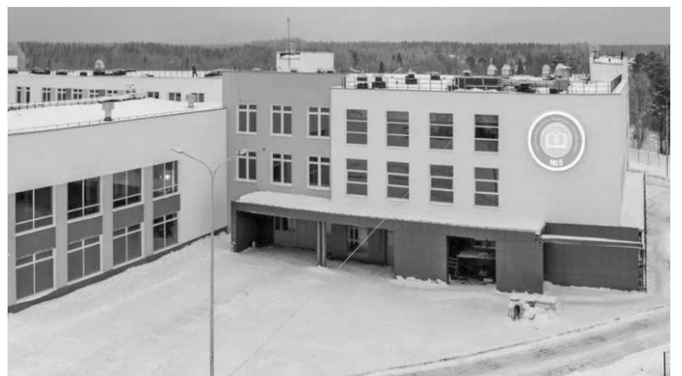
Школа в Деревянке