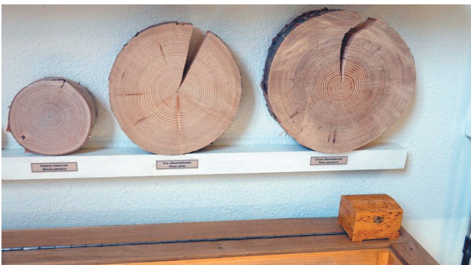
Музей прикладной экологии КарНЦ РАН