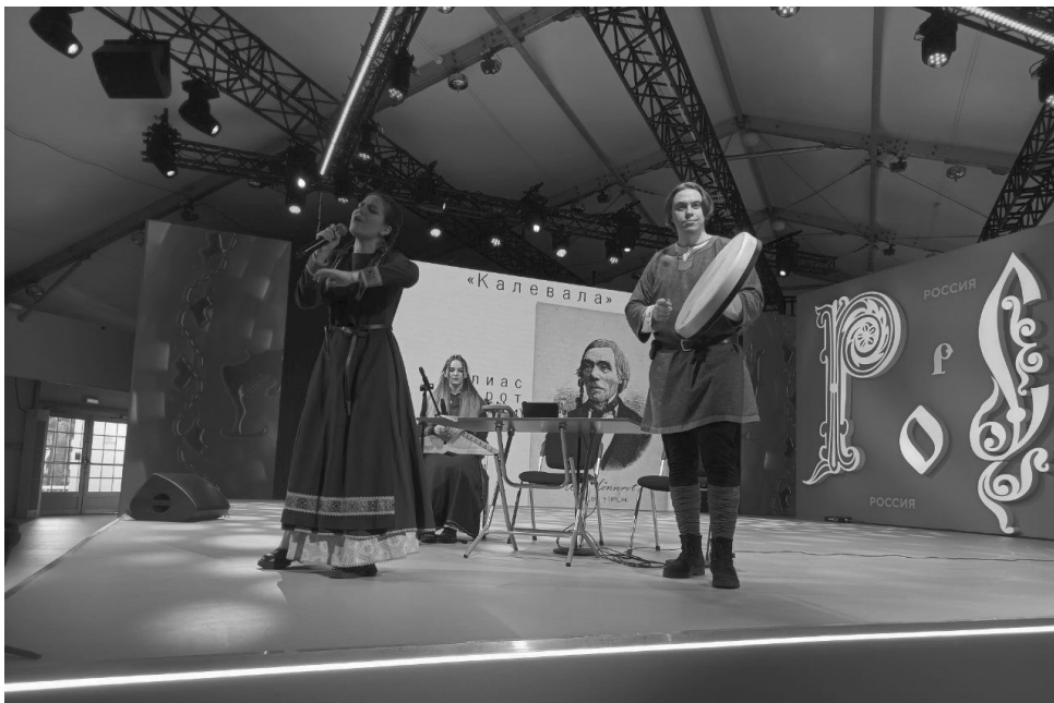
TUARI на ВДНХ