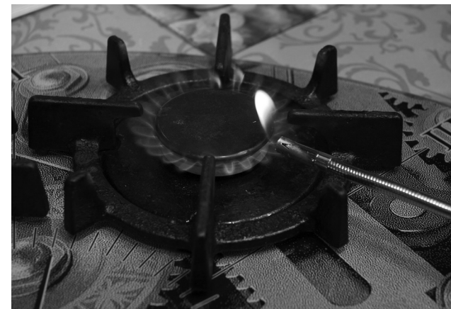
Газификация в поселке Шуя

При этом по предложению главы государства в 2025 году 39 регионов, где уровень рождаемости ниже среднего по стране, должны получить минимум 75 млрд рублей на дополнительные меры поддержки семей. Артур Парфенчиков поручил Минсоцзащиты