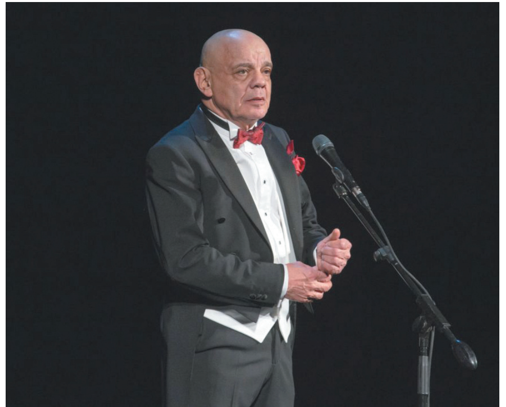
Константин Райкин в Петрозаводске