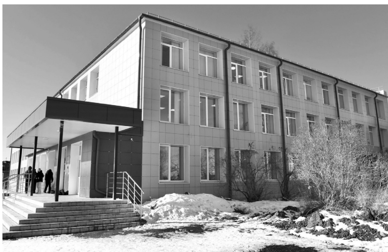
Школа в Шуе

– В Послании сделан акцент на развитие малых городов, сел, поселков. Всего программа развития должна охватить порядка 2 тысяч населенных пунктов. Здесь также должны сработать решения по поддержке регионов, включая инфраструктурные кредиты. Президент поручил активно использовать механизмы народного бюджета. Дополнительная поддержка будет оказана регионам, которые реконструируют набережные, парки, скверы и исторические центры городов. Прошу профильные министерства при доработке предложений в план обратиться на это особое внимание, – заявил Артур Парфенчиков.