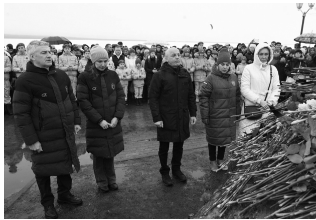
Руководители республики и Петрозаводска