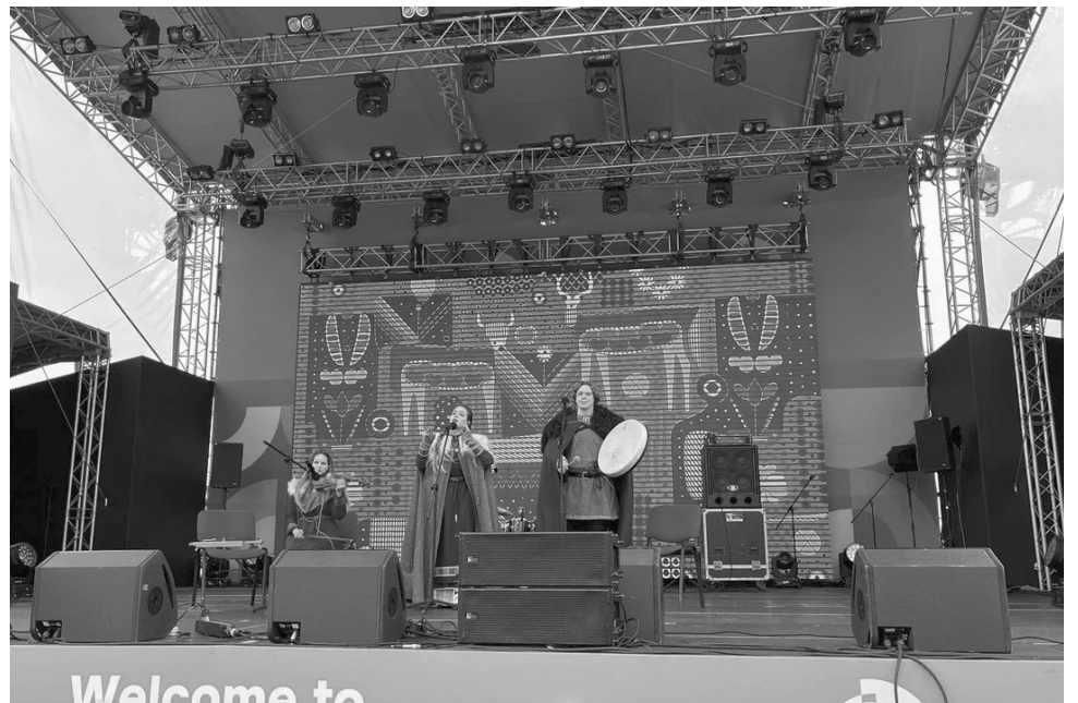
TUARI на всемирном фестивале молодежи в Сочи