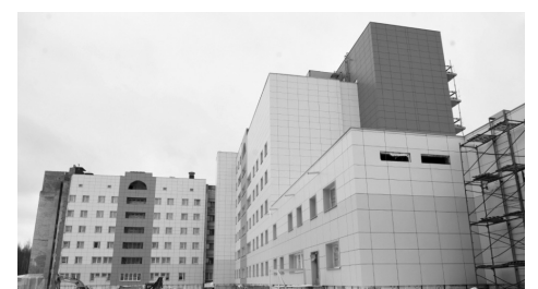
Корпуса на Древянке