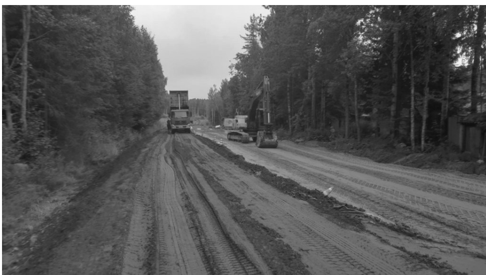
Ремонт дороги до Шапшезера

В Прионежском районе развивают возможности для занятий физической культурой и спортом. Так, в прошлом году в поселке Деревянка отремонтировали спортивный комплекс, в рамках ФЦП «Развитие Республики Карелия на период до 2030 года» продолжается реконструкция универсальной загородной учебно-тренировочной базы центра спортивной подготовки «Школа высшего спортивного мастерства» в Ялгубе. Работы первого этапа завершили 30 ноября прошлого года, объект ввели в эксплуатацию.